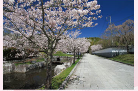
⑥アプローチ広場の桜並木(下手橋:4月上旬)