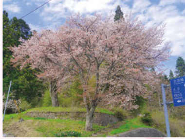
④宿の山桜(夫婦桜)(上君田:4月下旬)