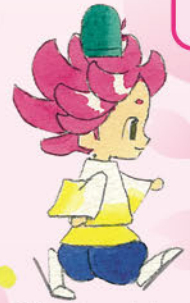
高萩市キャラクター「はぎまる」