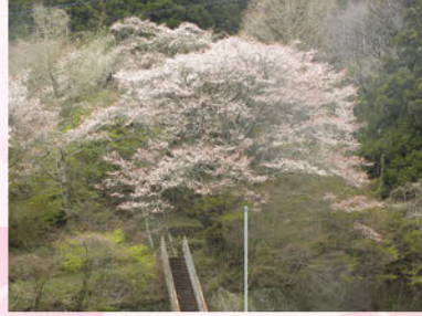
⑤横川小学校跡の山桜(横川:4月下旬)