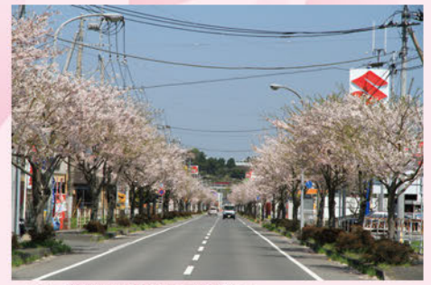
⑦国道461沿いの桜並木(安良川:4月上旬)