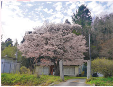
①大能小学校跡の山桜(大能:4月下旬)