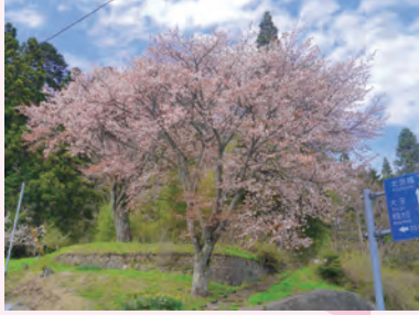
しよく ④宿の山桜(夫婦桜)(上君田:4月下旬)