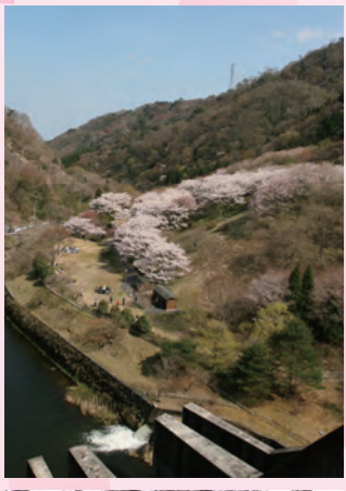
⑩花貫さくら公園(秋山:4月上旬) 左上は花貫ダムから見た花貫さくら公園、左下は同公園から見た花貫ダム。この公園では、約300本の桜に出会うことができます。