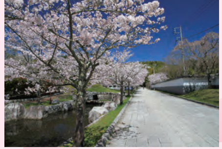
⑥アプローチ広場の桜並木(下手網:4月上旬)