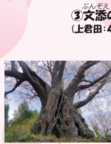
ぶんぞえ ③文添の山桜 (上君田:4月下旬)