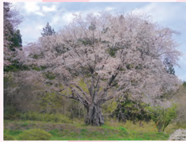
みやざわ ②上君田小学校跡の宮澤桜と特徴ある幹(上君田:4月下旬)