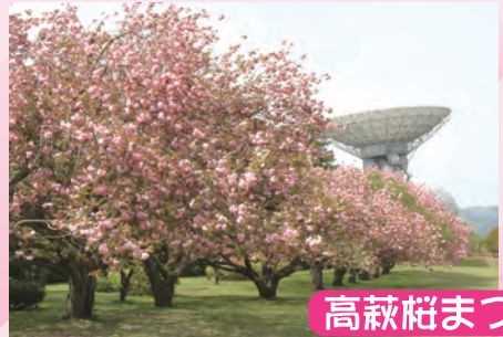
高萩桜まつり会場