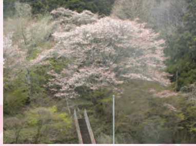
⑤横川小学校跡の山桜(横川:4月下旬)