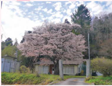
おおのう ①大能小学校跡の山桜(大能:4月下旬)