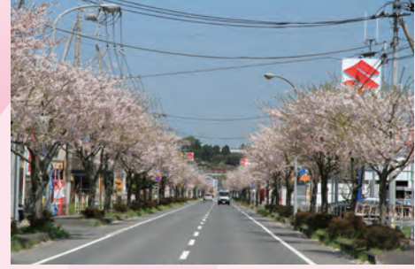
⑦国道461沿いの桜並木(安良川:4月上旬)