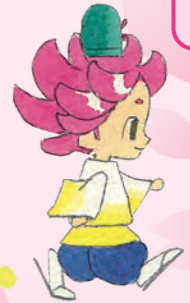
高萩市キャラクター「はぎまる」